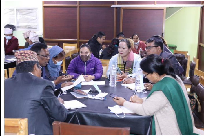
प्रदेश स्तरीय अन्तरधार्मिक कार्यशाला गोष्ठीहरु ।