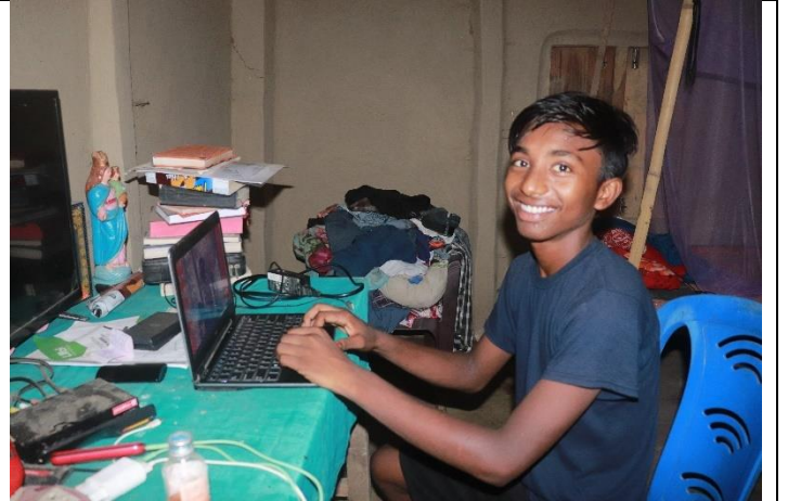
कम्प्युटर तालिम सहयोग प्राप्त गरेका एक सन्थाली युवा प्रसन्न मुद्रामा ।