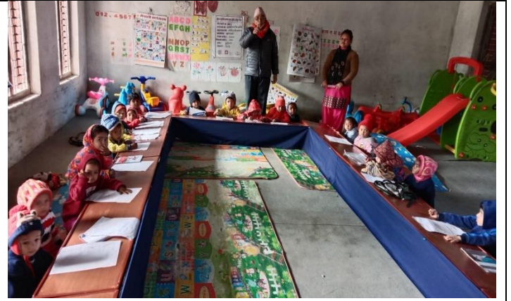
बालकक्षा सञ्चालनका लागि विद्यालयहरुलाई सहयोग कार्यक्रम ।