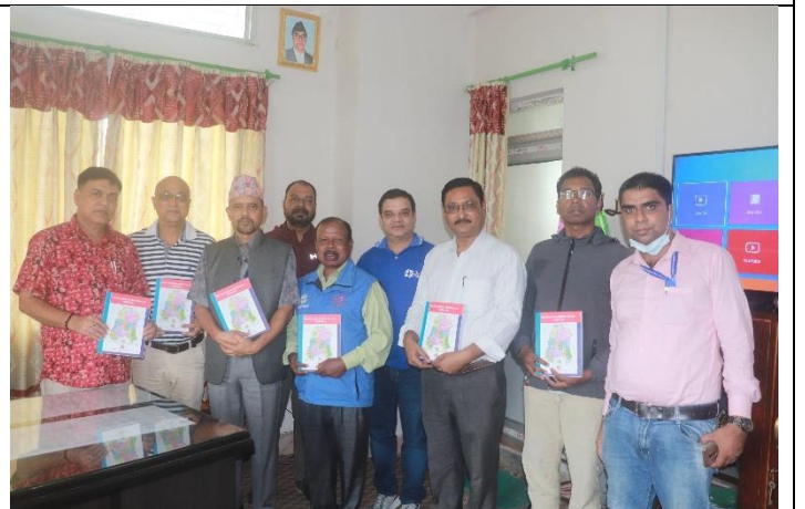
जिल्ला विपद पूर्वतयारी तथा प्रतिकार्य योजना २०७९ को विमोचन कार्यक्रम सामुहिक तस्वीर खिचाउँदै ।