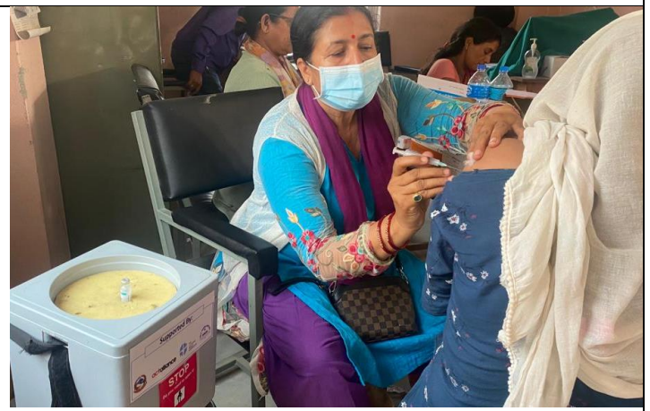
कोभिड-१९ भ्याक्सिनेसन अभियानका लागि स्थानीय पालिका तथा स्वास्थ्य संस्थाहरुलाई सहयोग कार्यक्रम ।