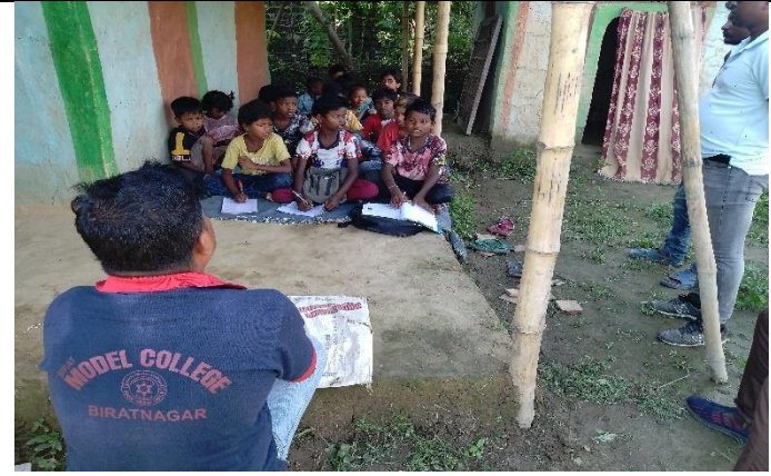
परियोजनाहरु मार्फत सञ्चालित ट्युसन सेन्टरको एक भ्रमक ।