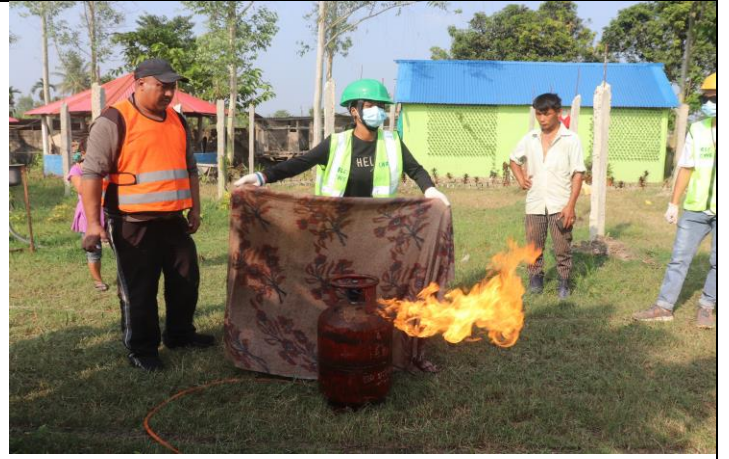
रयाँस सिलिण्डरमा आगो लागेको खण्डमा आगोलाई कसरी नियन्त्रण गर्न सकिन्छ, भन्ने विषयमा अभ्यास कार्यक्रम ।