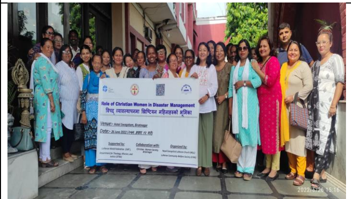
महिला दिदीबहिनीहरुलाई विपद व्यवस्थापन सम्बन्धी तालिम ।