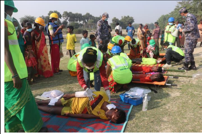
विपदको समयमा उद्धार तथा प्राथमिक उपचारका लागि पूर्वाभ्यास कार्यक्रम ।