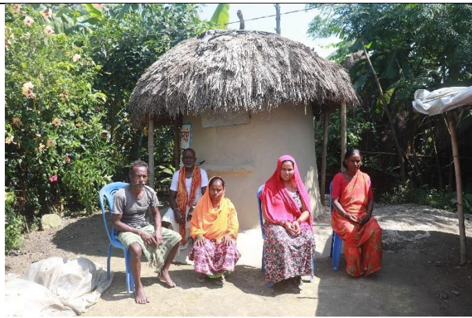
अन्नभकारी सहयोग प्राप्त रंगेली र का स्थानीय बासिन्दा ।