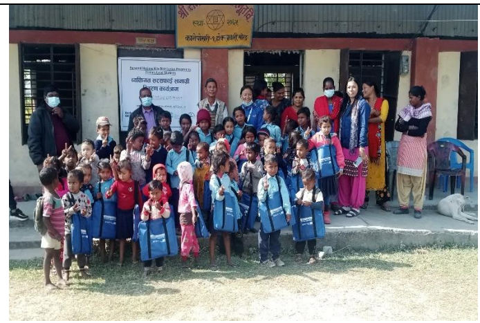
विद्यार्थीहरुलाई व्यक्तिगत सरसफाई सामग्री वितरण कार्यक्रम ।