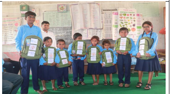
आगलागीबाट प्रभावित विद्यार्थीहरुलाई स्कूल ब्याग तथा ड्रेस वितरण ।