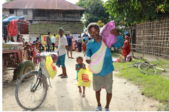
जहदा गाउँपालिका ७ तथा ५ का बाढीपीडितहरुलाई राहत वितरण कार्यक्रम ।