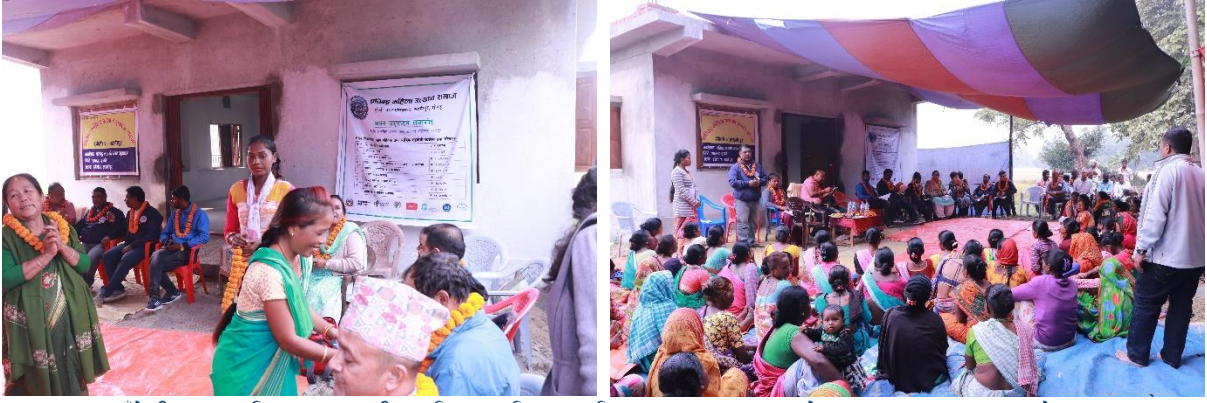
रंगेली नगरपालिका-२ लक्ष्मीपुर स्थित प्रतिबद्ध महिला उत्थान समाजको भवन उद्घाटन समारोह ।

कोभिड-१९ संक्रमणको जोखिम तथा प्रतिकार्यका लागि गरिएका क्रियाकलापहरूको तस्वीर: