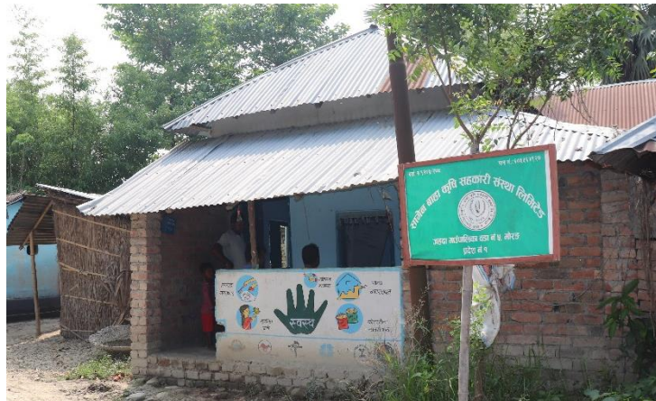
समुह तथा वि.व्य.स.द्वारा जहादा गाउँपालिका वार्ड नं. ५ सोहल टोलमा स्थापना गरिएको सहकारी ।