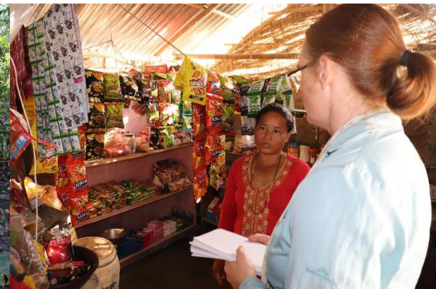
खोर निर्माण सहितको पशुपालन तथा व्यापार व्यवसाय स्थापना कार्यक्रम ।