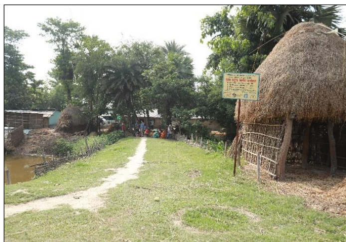
जहादा गा.पा. ५ सोहल टोलमा वि.व्य.स.को कार्ययोजना अनुसार निर्माण गरिएको कृषि सडक ।