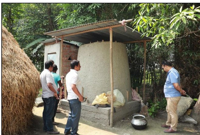
कानेपोखरी गा.पा १ विसनपुर होक्लावारीमा वि.व्य.स.द्वारा निर्मित सामुदायिक अन्नभण्डार ।