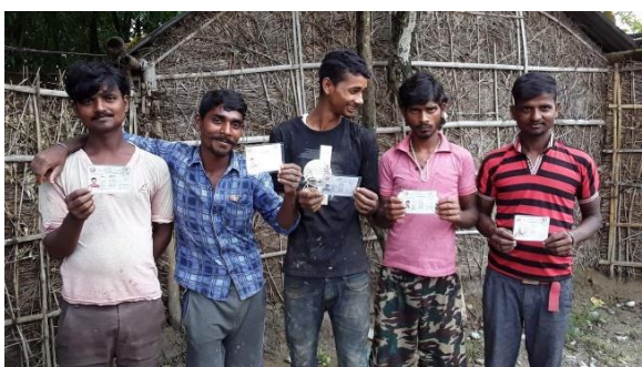
नागरिकता प्राप्त गरेपछि प्रसन्न मुद्रामा मुसहर (ऋषिदेव) युवाहरु ।