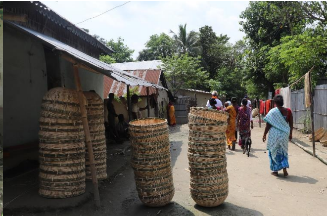
जहदा गा.पा ५ सोहलटोलका समुह सदस्यहरुलाई ढाकी तथा नाइलो बुनाई तालिम पछि लिइएको सामुहिक तस्वीर र विक्रीका लागि तयार ढाकीहरु ।