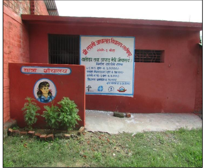
रंगेली नगरपालिका २ स्थित श्री लक्ष्मी आधारभूत विद्यालयमा निर्माण गरिएका बालबालिका तथा अपाङ्गमैत्री शौचालय ।