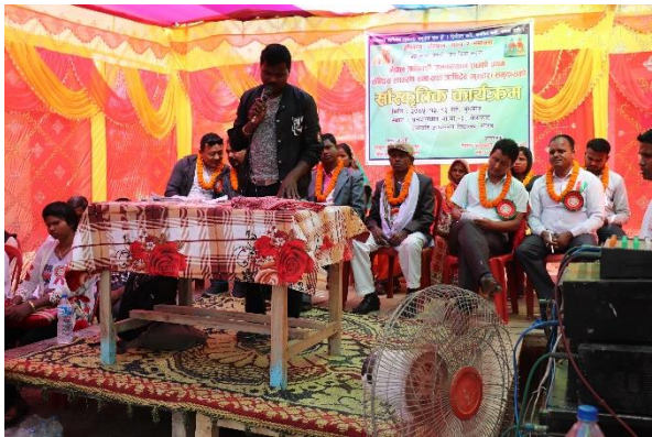
नेपाल ऋषिवंशी जनकल्याण संघ-मोरङको आयोजनामा सम्पन्न वार्षिक केन्द्रीय साधारण सभा तथा जातिय संस्कृति प्रवर्द्धनात्मक गोष्ठी कार्यक्रम ।